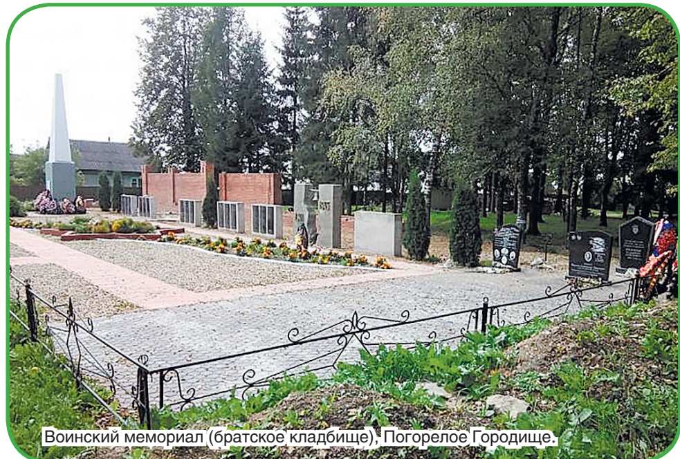
Воинский мемориал (братское кладбище), Погорелое Городище.