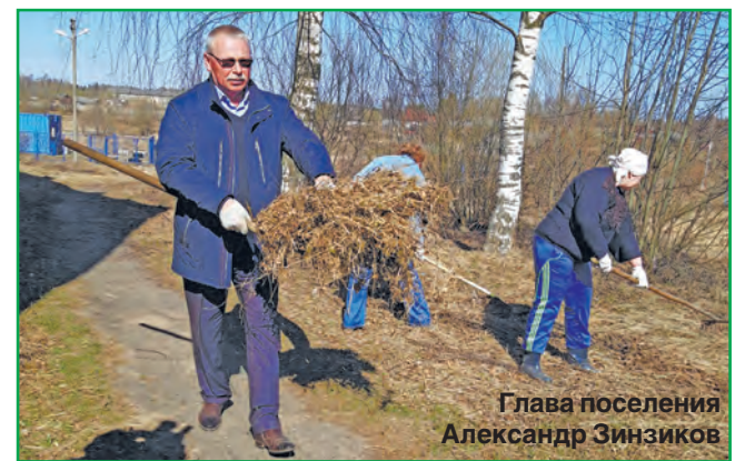
Глава поселения Александр Зинзиков