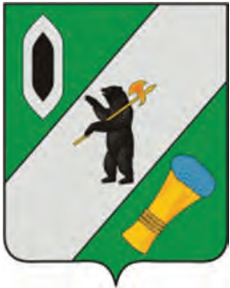
ГРАФИК РАБОТЫ выездных налоговых офисов на II квартал Уважаемые жители Гаврилов-Ямского района! Для вашего удобства на базе городского Дома культуры (Гаврилов-Ям, ул. Клубная, д.1) будут организованы выездные приемы специалистами налоговой службы. Налогоплательщики смогут получить квалифицированную помощь с 10 до 13 часов в следующие дни: - 29 апреля; - 21 мая; - 18 июня.