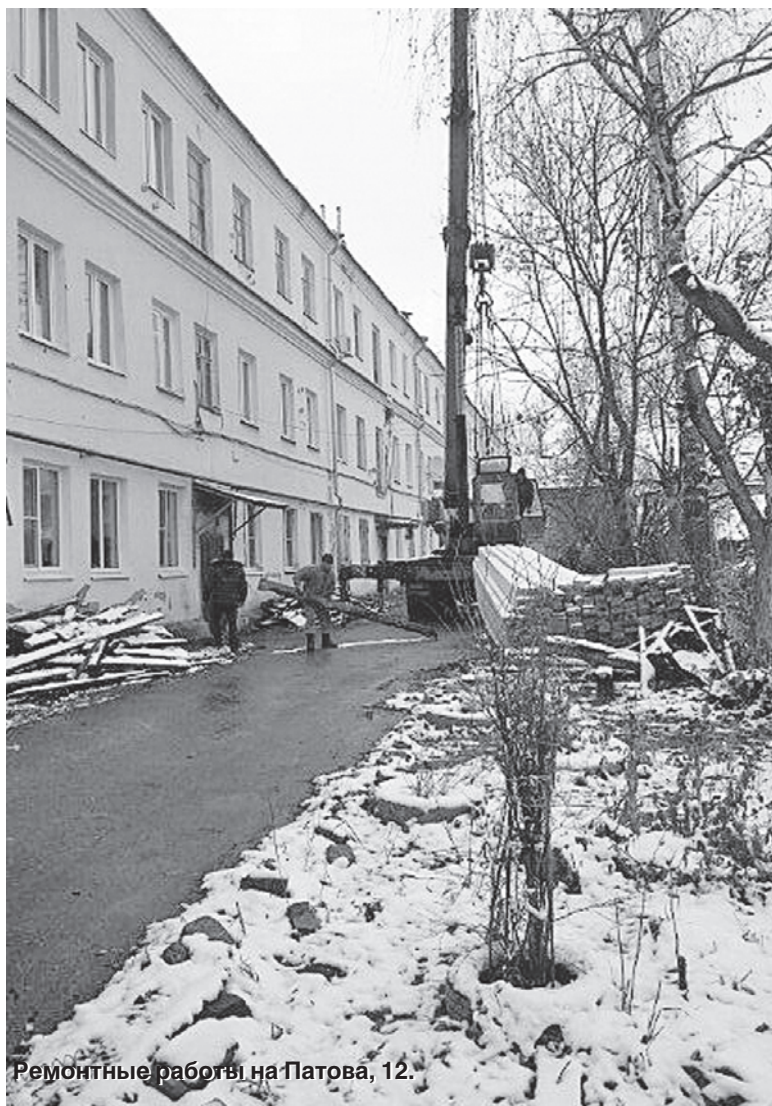
Ремонтные работы на Патова, 12.

Исходя из фактических сроков принятых решений по капремонту Региональный фонд только с апреля начал проводить конкурсные процедуры по выбору организаций на изготовление проектно-сметной документации. Однако на конкурс заявились только семь организаций. Существующий рынок предложений "проектировщиков" оказался не подготовленным для