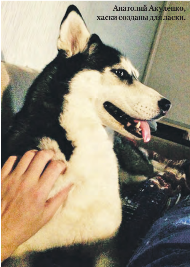
Анатолий Акуленко, хаски созданы для ласки.