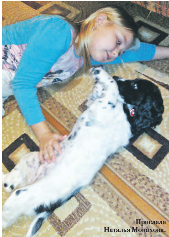
Прислала Наталья Монахова.