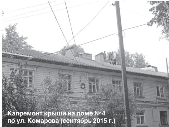
Капремонт крыши на доме №4 по ул. Комарова (сентябрь 2015 г.)

Опять же нужно заметить: конкурсный отбор подрядчиков производится в рамках действующего законодательства. Иначе говоря, просто поделить объем работ по капремонту между организациями, имеющими работников-профессионалов, хорошую материальную базу и большой опыт работы, - в нашей