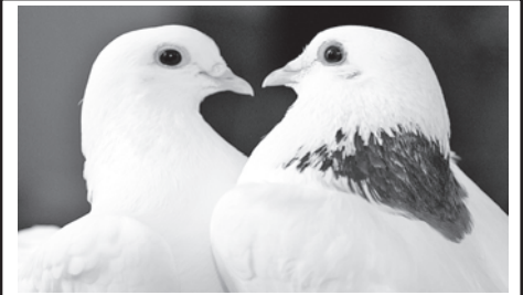
Пара голубей на свадьбу. Тел. 8-905-646-73-41.

5.30 "Домашняя кухня" (16+). 6.00, 7.30, 18.00, 23.35 "Одна за всех" (16+). 6.30 "Сделай мне красиво" (16+). 7.00 "Был бы повод" (16+). 7.50 Д/с "Звездная жизнь" (16+). 9.50 Т/с "ПОДЗЕМНЫЙ ПЕРЕХОД" (16+). 18.05 Т/с "НЕ РОДИСЬ КРАСИВОЙ" (12+). 19.00 Х/ф "ЖЕНИТЬ МИЛЛИОНЕРА" (16+). 22.35, 4.05 Д/с "Звездные истории" (16+). 0.30 Х/ф "ДОЧКА" (16+). 2.20 Х/ф "ПОВТОРНАЯ СВАДЬБА" (12+).