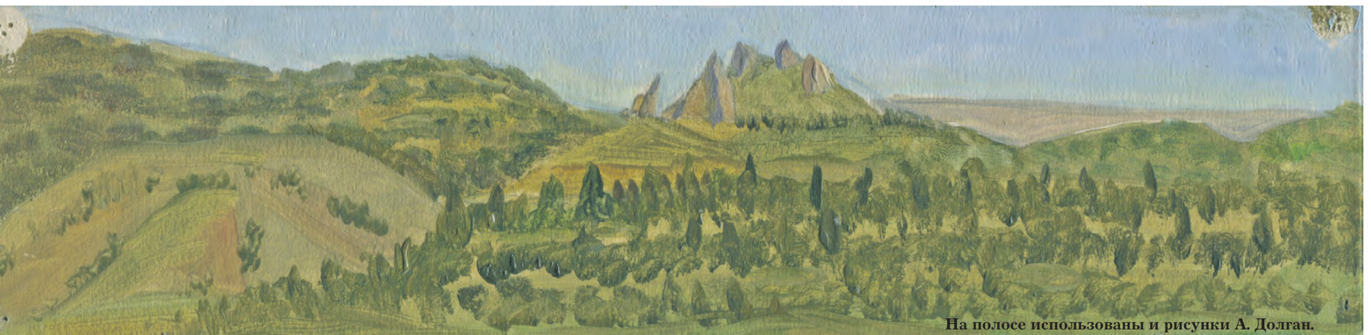
На полосе использованы и рисунки А. Долган.

И он ушел, скрылся в сумерках. И утром не пришел, не пришел и к обеду. Настя не находила себе места. Потом пришел Пашка и сообщил, что Димка уехал, укатил в свой Архангельск. Не попрощавшись. Может быть, не хотел расстраивать. Настя проревела весь день. Она рыдала громко, навзрыд, и ее никак не могли успокоить.