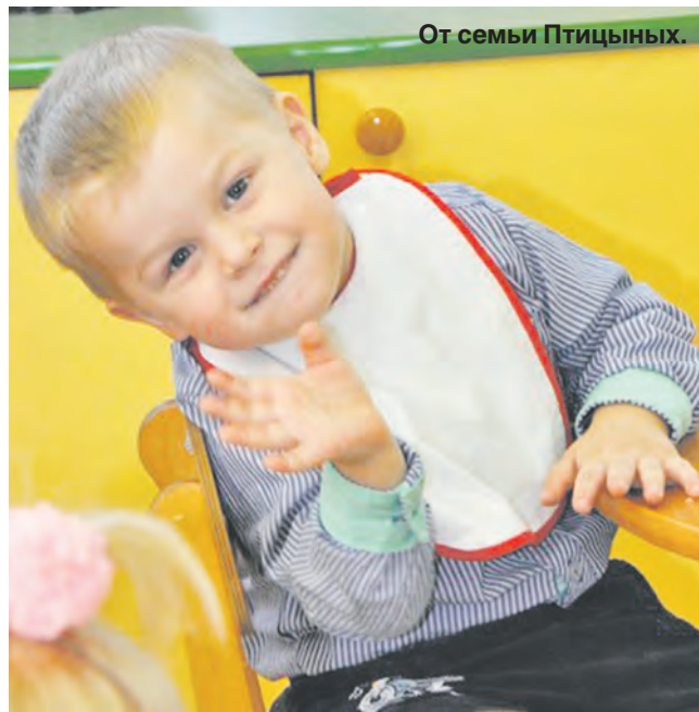
От семьи Птицыных.