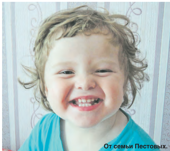
От семьи Пестовых.