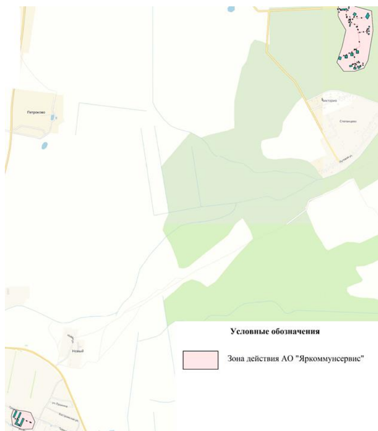
Присоединенная нагрузка в зоне действия источника