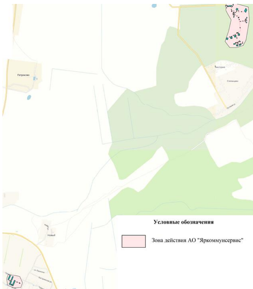
Присоединенная нагрузка в зоне действия источника